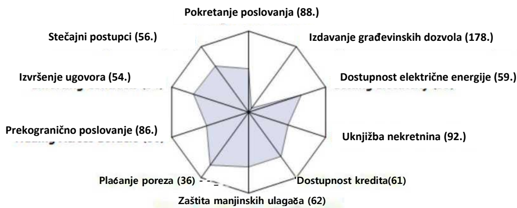
Slika 1.2. Poslovni propisi u Hrvatskoj prema izvješću Doing Business 2015 (Ljestvica: 189. mjesto centar, 1. mjesto vanjski rub)