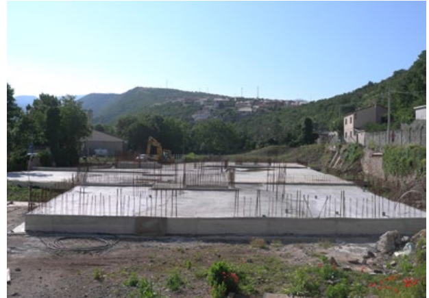
Započeti radovi na gradilištu