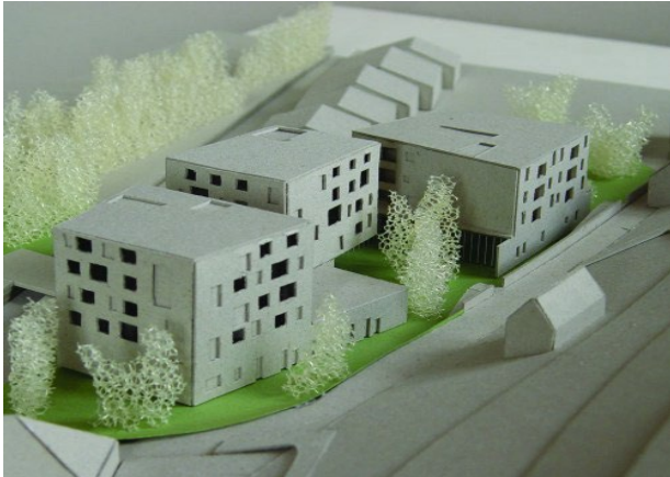
Budući izgled Doma za starije i nemoćne