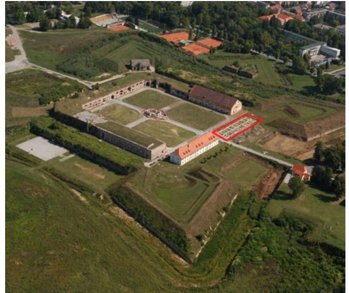
Tvrđava Brod s označenim temeljima budućeg hotela

Hotel će se sastojati od 32 sobe s 58 kreveta i 4 apartmana s 8 kreveta. Tijekom izgradnje hotela, investitor će se morati pridržavati svih zahtjeva konzervatora.