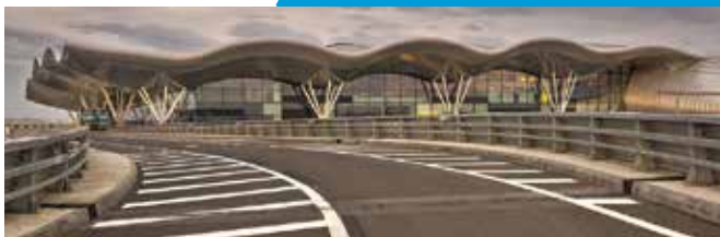
PROJEKT: MEĐUNARODNA ZRAČNA LUKA ZAGREB

Projekte JPP-a ovlaštena su predlagati isključivo javna tijela.